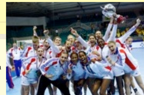
Mondial Junior 2012 CZE : FRANCE, vice-championne du Monde